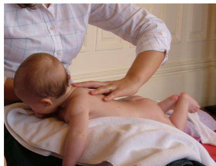
Curso de Preparação para o Parto no Centro de Saúde SMF