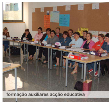
formação auxiliares acção educativa