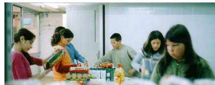
Jovens voluntários no processo de armazenamento dos alimentos

Podem contribuir empresas, associações e cidadãos anónimos, através da oferta de alimentos cujo o prazo de validade seja longo e a embalagem esteja protegida dos agentes externos que levam à sua deterioração.