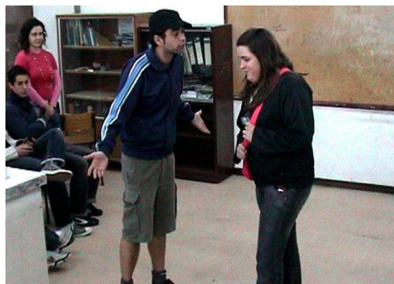
Sessão de Teatro-Fórum numa escola

Está ainda previsto o arranque da intervenção em grupo com agressores em estreita parceria com a Direcção Geral de Reinserção Social para o último trimestre de 2008.