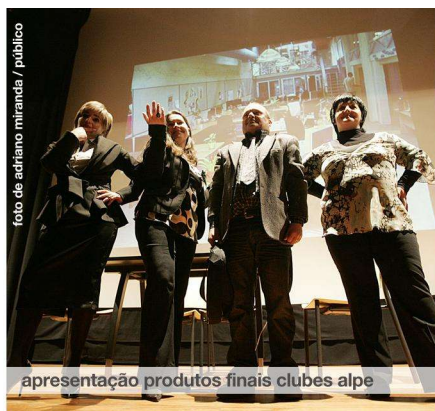
apresentação produtos finais clubes alpe