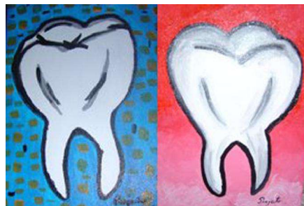
Pintura dos jovens oferecida aos dentistas

Mais de 150 jovens foram encaminhados e beneficiaram de tratamento.