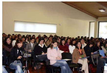
Seminário no auditório da Casa Ozanam

No passado mês de Novembro realizou-se um seminário com o tema “Violência Doméstica - Que Direitos, Que Desafios?”. Reuniram-se cerca de 270 técnicos de instituições concelhias e extra-concelhias que, pelas suas experiências e formações profissionais, proporcionaram momentos de discussão e participação construtiva. Os temas apresentados passaram pela intervenção com agressores, o papel da criança na violência doméstica, a lei na violência doméstica, a intervenção com mulheres vítimas de violência doméstica e o Teatro-Fórum e a prevenção neste âmbito.