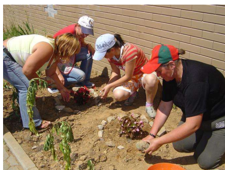
Actividades com os moradores do Empreendimento Social de Caldas de S.Jorge

Esta experiência piloto a nível concelhio está a revelar-se uma forma de garantir melhores condições de higiene e limpeza dos espaços comuns dos empreendimentos sociais, proporcionando aos seus habitantes um ambiente mais saudável e uma melhor qualidade de vida.