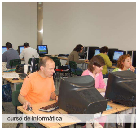
curso de informática